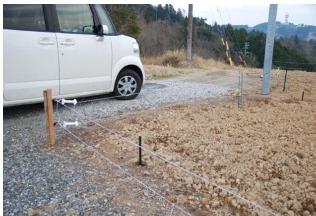
イノシシ除け電気柵

今回の改植では単条植えを採用したとのことでしたが、成園後の根の競争を少なくし張りを重視するため選んだとのことでした。