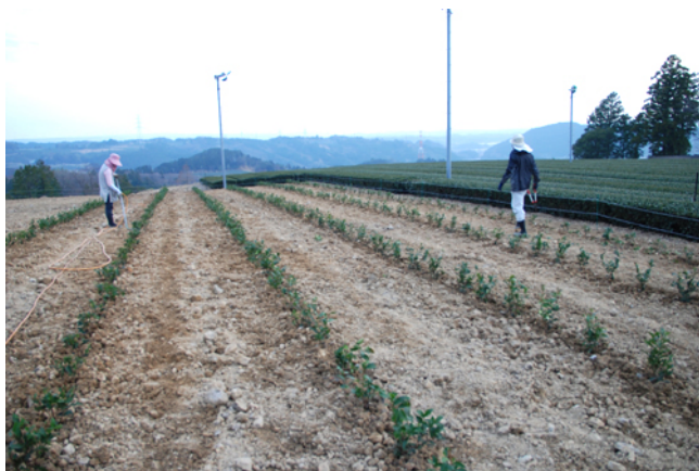
茶の苗木を植えます