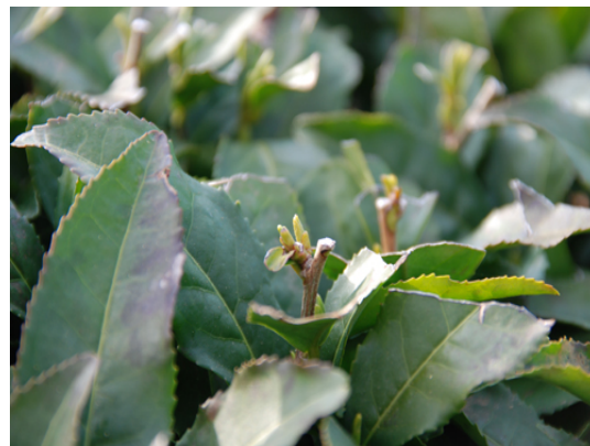
小夜鹿 中山茶業組合