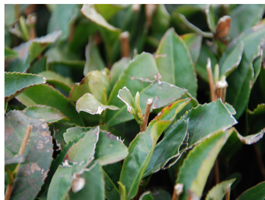
東山 東山茶業組合

今回の巡廻では主に日坂、東山を見て参りました。芽はそれぞれの早場所でもまだ出たばかりの状況で、各生産農家さんでは3/10位より順次、防霜ファンの電源を入れ、朝の霜による冷害の対応をはじめております。この時期は皆さん防霜ファンのチェックをはじめ、施肥など今年の新茶に向けた準備で結構忙しい時期でもあります。