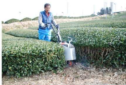
鋤で畦に空気を入れるとともに、肥料を地中へ入れます